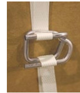
BOUCLES INDUSTRIELLES 3/4" - 1000/bte No modèle PB908 Prix/Chacun $