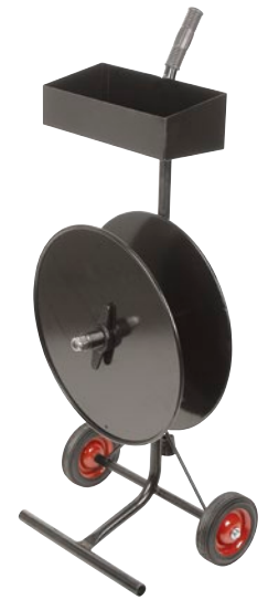
DISTRIBUTEUR No modèle PB753 Prix/Chacun $